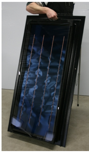
De ATON C0.5 collector